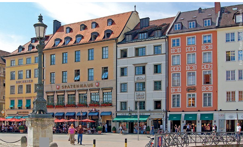
Die Flexibilität eines Gebäudes im Hinblick auf seine Nutzung ist ein Qualitätsmerkmal. Für die Zukunft eines Hauses ist entscheidend, ob es den wechselnden Bedürfnissen der Menschen auch nach vielen Jahren noch gerecht werden kann.

Der berühmte Architekt Mies van der Rohe soll in einem Gespräch schon 1964 gesagt haben: „Menschkind, mach‘ doch die Bude groß genug, dann kannst du hin und her laufen und nicht bloß in einer vorgezeichneten Bewegung. [...] Wir wissen ja gar nicht, ob die Leute das benutzen, wie wir es gerne möchten. Die Funktionen sind erstens mal nicht eindeutig, und dann sind sie nicht beständig, die wechseln viel schneller als der Bau.“ Diese über 40 Jahre alte Aussage hat noch immer ihre Berechtigung, denn Städte sind lebendige Lebensräume, die sich immer wieder verändern. Wurden sie vor Jahrzehnten autogerecht ausgebaut und nach Nutzung gegliedert, steht heute die Durchmischung von Wohnen, Arbeiten, Kultur und Einkaufen im Vordergrund. Im Wandel muss sich erweisen, ob die bestehenden Gebäude zukunftsfähig und in ihrer Nutzung flexibel sind. Im positiven Fall finden dann zum Beispiel leer stehende Bürogebäude oder Läden eine neue Verwendung.