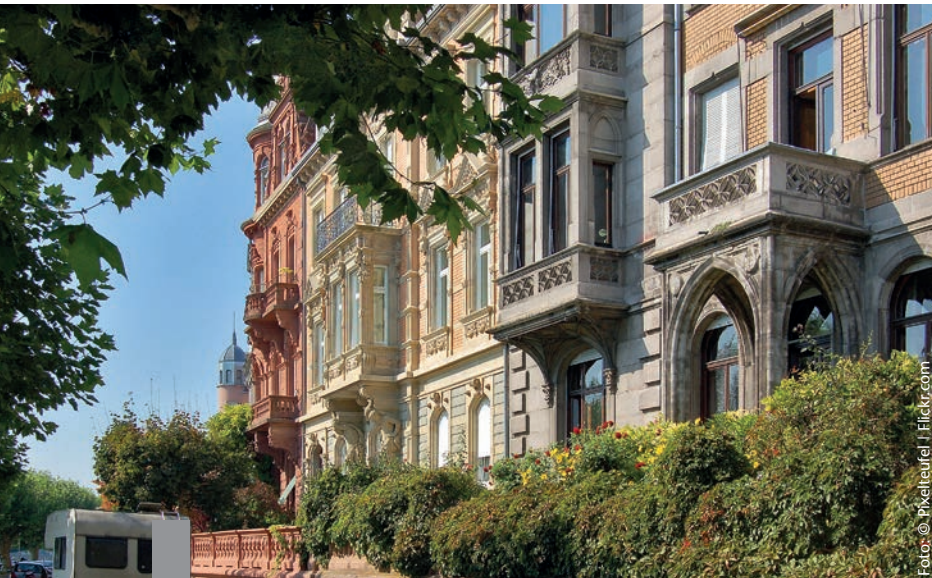
Mittelschicht Haushalte und junge Menschen zieht es in die beliebten Quartiere der Innenstädte, die als Ausdruck eines neuen, urbanen Lebensstils gelten.

Das Zusammenspiel von Angebot und Nachfrage auf dem Wohnungsmarkt stimmt in einigen Metropolen nicht mehr. Steigende Mieten und Wohnungsknappheit sind in vielen Großstädten die Folge. In den attraktiven Quartieren geht die mit Investitionen und einer Aufwertung von Wohnungsbeständen einher. Diese Entwicklung kann zur Verdrängung alteingesessener Bewohner durch zahlungskräftigere Bevölkerungsgruppen führen, und die Quartiere können an Vielfalt verlieren. „Aufwertung ist unerlässlich, um Städte zukunftsfähig zu gestalten. Dabei müssen allerdings sozialverträgliche Wege gefunden werden, so dass Aufwertung nicht zwangsläufig mit Verdrängung einhergeht und mit Luxussanierung gleichgesetzt wird“, sagt Harald Herrmann, der Direktor des BBSR. „Im Idealfall begleiten Stadtentwicklungs- und Wohnungspolitik die Aufwertung von Quartieren, so dass Verdrängung vermieden wird. Das erfordert Aufmerksamkeit, Mut und auch neue Lösungsansätze.“