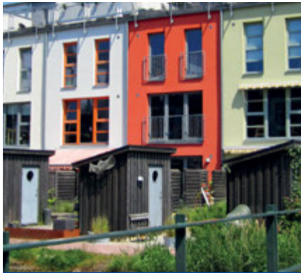
Ein hoher Wasserverbrauch verursacht gleich zweimal Kosten – einmal für Frischwasser und einmal für Abwasser.

Viele Gemeinden lassen es bei Häusern mit Garten zu, dass der Wasserverbrauch des Außenwasserhahns mithilfe einer