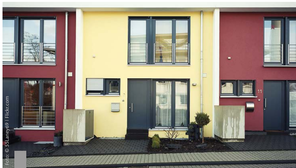
Die niedrige Eigentumsquote bei Immobilien in Deutschland steht in engem Zusammenhang mit der Verteilung der Haushaltsvermögen in Europa.

Die Studie der europäischen Notenbanken ließ aufhorchen. Danach sind die Menschen in den südeuropäischen Krisenländern reicher als in Deutschland. Der Studie liegt eine Befragung zum Vermögen von 62.000 Haushalten in 15 Euroländern zugrunde. Die entscheidende Aussage lautet: Immobilieneigentum ist ein wichtiger Faktor für Reichtum. Die ermittelten Werte geben den sogenannten Median an, also den Mittelwert, nach dem die eine Hälfte der Haushalte mehr und die andere Hälfte weniger Vermögen hat. Die Länder mit den höchsten Haushaltsvermögen sind Luxemburg, Zypern und Malta. Der Median beträgt beispielsweise in Luxemburg 398.000 und in Zypern 267.000, in Deutschland dagegen nur 51.000 Euro je Haushalt. Das ist der niedrigste Wert unter den befragten Ländern. Genauso verhält es sich mit der Eigentumsquote bei Immobilien. In Deutschland beträgt sie lediglich 44 Prozent – ebenfalls der niedrigste Wert – gegenüber 68 und 77 in Luxemburg bzw. Zypern.