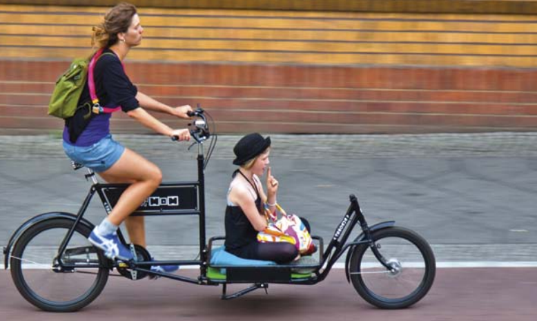
Das Fahrrad ist ein praktisches und umweltfreundliches Fortbewegungsmittel.

Die Stadt Münster führt auch diesmal den ADFC-Fahrradklima-Test bei den Städten über 200.000 Einwohnern an. Der Test fand 2012 zum fünften Mal statt und wurde unterstützt vom Bundesministerium für Verkehr, Bau und Stadtentwicklung. Rund 80.000 Radfahrer machten mit – beim letzten Fahrradklima-Test 2005 waren es nur 26.000. Andere Städte haben seitdem aufgeholt: Freiburg, im letzten Fahrradklima-Test nicht in der Wertung, steigt bei den Städten über 200.000 Einwohner direkt auf Platz zwei. Bei den Städten in der Kategorie 100.000 bis 200.000 Einwohner konnte Erlangen seinen Titel verteidigen, gefolgt von Oldenburg und Hamm. Bei den Großstädten über 200.000 Einwohnern gehört Karlsruhe, das „Fahrradstadt Nummer eins in Süddeutschland“ werden will, zu den heimlichen Gewinnern – stärker hat sich keine andere Stadt dieser Größe verbessern können. Das gilt auch für Potsdam bei den Städten mittlerer Einwohnerzahl und für Wernigerode in der Kategorie der Städte bis 100.000 Einwohner.