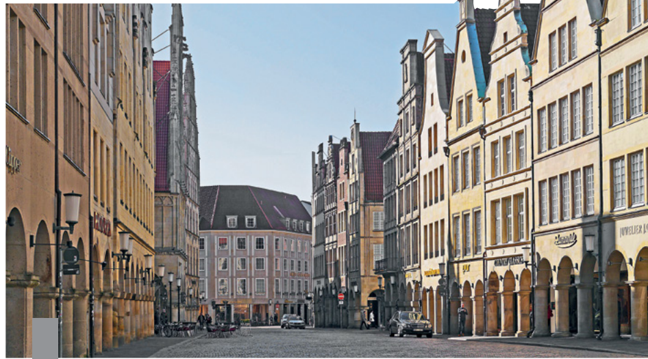
Die unverändert hohe Nachfrage nach Immobilien und die zu geringe Neubautätigkeit ziehen Preissteigerungen von drei bis fünf Prozent bis Ende 2017 nach sich.

Nach Ansicht vieler Immobilienspezialisten werden die Kaufpreise von Immobilien in 71 der 79 deutschen Großstädte noch weiter steigen. Die höchsten Steigerungen werden kleine Großstädte unter 500.000 Einwohnern verbuchen. Sie holen den Trend der Metropolen und Topstandorte nach. Die Prognose bis 2030 sieht etwas anders aus. Die schrumpfende Bevölkerung und eine veränderte Altersstruktur werden zu einer wachsenden regionalen Polarisierung der Immobilienpreise führen. Aufgrund der sinkenden Nachfrage nach Immobilien werden die Marktwerte für selbst genutzte Eigentumswohnungen bis 2030 in einem Drittel aller deutschen Kreise und kreisfreien Städte um mehr als 25 Prozent sinken. Bei Ein- und Zweifamilienhäusern könnte das in einem Viertel aller Kreise der Fall sein. Vor allem ländliche Regionen in Ostdeutschland werden betroffen sein. In und um Ballungszentren wie München, Frankfurt oder Hamburg ist dagegen mit weiteren Preisanstiegen zu rechnen.