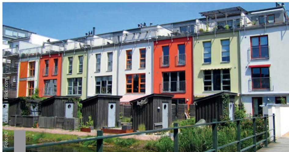
Nie war es leichter als jetzt, Wohneigentum zu bilden.

Die selbst genutzte Wohnimmobilie hat vor allem wegen der historisch niedrigen Zinsen deutlich an Attraktivität gewonnen. Während 2008 nur 43 Prozent der Wohnungen von Eigentümern bewohnt wurden, waren es 2010 bereits knapp 46 Prozent. Eine weitere Steigerung der Quote ist unter den aktuellen Rahmenbedingungen zu erwarten. Dabei ist die Entscheidung „mieten oder kaufen?“ weniger eine Frage des Geldes als der individuellen Einstellung und Lebenssituation. Das IW Köln hat untersucht, wo sich das Kaufen und Mieten besonders lohnt. Im Jahr 2009 war das Vermieten bzw. Mieten in 73 Prozent aller Landkreise die vorteilhaftere Wohnform, während lediglich in sieben Prozent das Kaufen lohnender war. 2013 war das Kaufen bereits in 27 Prozent und das Mieten in nur noch 22 Prozent aller Landkreise die günstigere Wahl. Auch das Institut für Städtebau geht von einer steigenden Eigentümerquote und einer steigenden Nachfrage aus. Überdurchschnittlich hohe Zuwächse bei der Wohnflächennachfrage werden vor allen in München, Berlin, Hamburg, Bonn und Stuttgart sowie in Teilen Brandenburgs im Speckgürtel um Berlin, in Nordniedersachsen, Bayern und Baden-Württemberg erwartet.