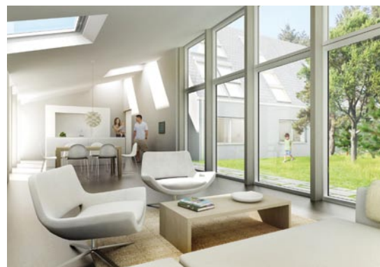
Grafik: VELUX Deutschland GmbH

Grundlage war ein 50er-Jahre-Haus, das aufwändig umgebaut wurde. Große Dachfenster lassen viel Sonne herein, auf einem Anbau sind Solarthermie-Elemente für Heizung und Warmwasser angebracht. Fotovoltaik-Flächen erzeugen Strom. Mit der Solarthermie-Anlage ist eine Luft-Wasser-Wärmepumpe gekoppelt. Ab September 2011 soll eine Familie das Gebäude mietfrei bewohnen – als „Testbewohner“. Ein Jahr lang werden dann Messwerte gesammelt und geprüft, ob das Konzept praxistauglich ist. Dann wird das Haus verkauft – der Preis steht noch nicht fest.