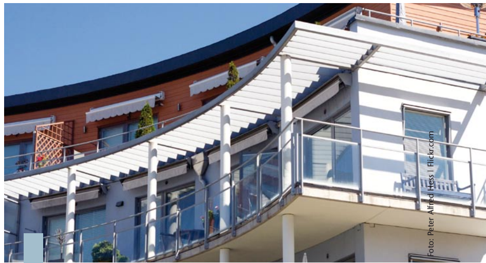
Hohe Preisforderungen in den Metropolen veranlassen Immobilienkäufer und -anleger dazu, ihr Interesse verstärkt auf B-Standorte und Stadtrandlagen zu richten.

Die Kapriolen der Finanzmärkte wirken sich auf den Immobilienmarkt nur geringfügig aus – und Einflüsse aus dem Ausland sind in diesem Bereich kaum spürbar. Dagegen bewirkt der Konjunkturaufschwung in Deutschland, dass mehr investiert, mehr gebaut und mehr saniert wird, denn Immobilien gelten zu Recht als sicher. Der Angebotspreisindex IMX von ImmobilienScout24, welcher aus über zehn Millionen Immobilienangeboten ermittelt wird, zeigt: Die Angebotspreise sowohl für Bestands- als auch für Neubauimmobilien sind im vergangenen Vierteljahr gestiegen. Allerdings scheint das Wachstum weniger in den Top-Standorten der Metropolen stattzufinden: Hier halten die Preise ihr Niveau. Vielmehr sind zunehmend B-Standorte und Stadtrandlagen gefragt. Die Käufer weichen offenbar auf günstigere Objekte am Stadtrand aus. Im Bundesdurchschnitt ist der Angebotspreis für Neubauwohnungen zwischen Juni 2010 und Juni 2011 um 5,8 Prozent gestiegen, für Bestandswohnungen um 2,9 Prozent. Bei neu gebauten Wohnhäusern stieg der Angebotspreis um 4,2 Prozent, bei Bestandshäusern um 2,2 Prozent.