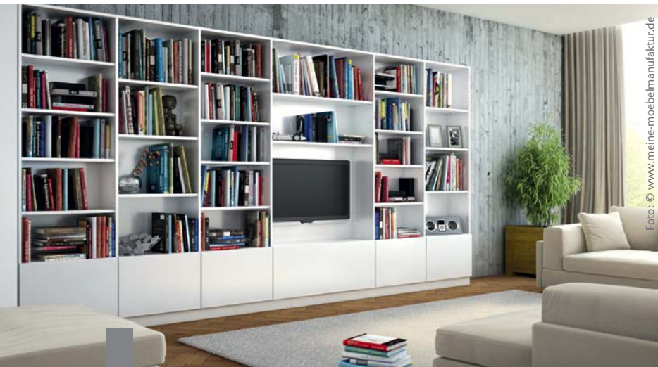
Gegensätze ziehen sich an: In der richtigen Kombination bewirken verschiedenartige Materialien eine besondere Atmosphäre im Raum.

Holz, Glas, Wolle, Stahl, Kupfer, Beton, Kaschmir – der Trend zum Materialmix hat die Inneneinrichtung erreicht. Aus verschiedenen Farben und Materialien lassen sich gemütliche Wohnwelten zaubern. Auch Beton kann ein warmer Farbakzent in den eigenen vier Wänden sein. Das harte Material hat sich dank vieler junger Designer zu einem Deko-Kult entwickelt. Zum gemütlichen Wohnaccessoire wird es in Kombination mit warmen Lichtelementen. Experten raten zum Gegensatz: Wärmendes Licht und kalter Baustoff wirken zusammen besonders interessant. Die aktuellen Wohnwelten werden von geometrischen Formen bestimmt: Würfel, Pyramide, Zylinder oder Kegel – alles geht. Farbige Möbelstücke machen gute Laune und liegen voll im Trend. Kleine Räume vertragen allerdings nicht viel Farbe, weil sie dann schnell überladen wirken.