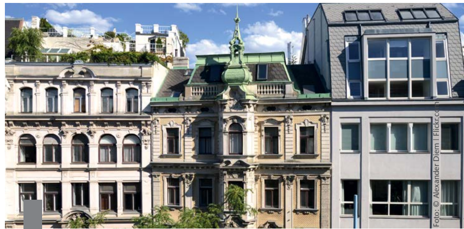
Das Jahr hat gut angefangen. Alles deutet auf eine weiterhin positive Entwicklung des Immobilienmarktes hin.

Nachdem das vergangene Jahr ein außergewöhnlich gutes Jahr für die Immobilienwirtschaft war, stellt sich die Frage, wie es weitergeht. Setzt sich der Preisschub kontinuierlich fort oder wird er schwächer? Ist gar eine Preisblase zu befürchten? Der Immobilienverband Deutschland IVD empfiehlt Eigentümern einer Stadtwohnung als Kapitalanlage, einen Verkauf zu prüfen. Der optimale Zeitpunkt sei jetzt. Der deutliche Nachfrageüberhang in den Top-Städten ermögliche es, die Wertsteigerungen der letzten Jahre zu realisieren. Von einer Überhitzung des Marktes gehen Fachleute nicht aus. Die aktuelle Analyse der Hauspreiszyklen der OECD-Länder zeigt, dass der Preisanstieg in Deutschland im Vergleich mit vergangenen Anstiegen moderat ausfällt. DB-Research erwartet, dass sich der Anstieg der Immobilienpreise in Deutschland fortsetzt, hält aber die Bildung einer Blase für unwahrscheinlich. Die dynamische Entwicklung ist auch eine Folge der niedrigen Zinssätze. Darlehensnehmer können sich jetzt die niedrigen Zinsen durch längere Laufzeiten sichern und den Spielraum für eine höhere Tilgung nutzen. Das ist vernünftig. Vorsicht ist aber bei Anbietern geboten, die für Vollfinanzierungen ohne Eigenkapital werben. Die grundsätzlich konservative Haltung der hiesigen Finanzierungsinstitute hat Deutschland vor einer Immobilienkrise wie einst in den USA oder England bewahrt.