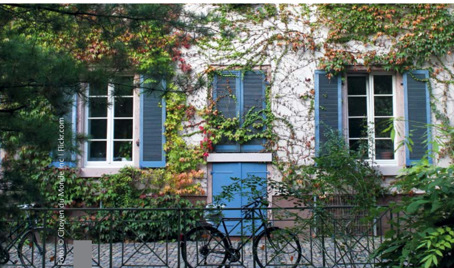
Wohneigentümer passen ihre Wohnverhältnisse im Laufe des Lebens mehrmals an veränderte Bedürfnisse an.

Die über 50-Jährigen sind oft gut situiert und stellen hohe Ansprüche an das Wohnen. Mehr als die Hälfte besitzt eine eigene Immobilie, die vor 25 oder 30 Jahren gebaut oder gekauft wurde. Jetzt stehen Renovierungs- oder Umbaumaßnahmen an. Mehr Energieeffizienz und barrierefreies Wohnen sind den älteren Eigentümern besonders wichtig. Laut einer Studie der BHW BauSparkasse haben 49 Prozent der über 50-Jährigen an ihrem Haus oder ihrer Wohnung schon einmal Maßnahmen zur Energieeinsparung durchgeführt, weitere 15 Prozent planen, in den kommenden zwei bis drei Jahren nachhaltige Verbesserungen umzusetzen. Die Investition lohnt sich, denn in Altbauten steckt viel Potenzial für hohen Wohnkomfort und Lebensqualität im Alter.